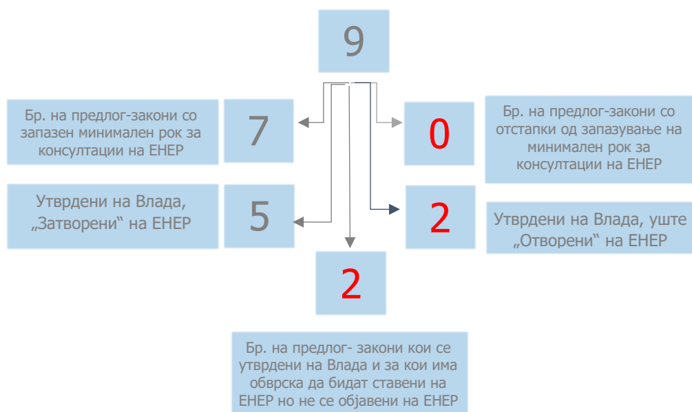
Табела. Преглед на објавени предлог-закони по министерства и почитување на обврската за консултации со јавноста на ЕНЕП

Предлог-закони утврдени на седница на Владата во период од 1 до 31 мај 2018 г.