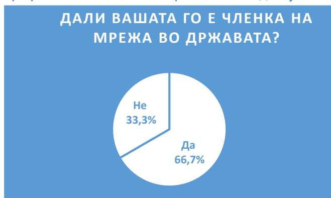
Графикон 1. Членство во мрежи во Македонија

Две третини од граѓанските организации одговориле дека членуваат во една или повеќе мрежи. Забележан е благ пораст на членувањето во мрежи во споредба со претходните истражувања на МЦМС каде членството на организациите во мрежи било 64,6 % во 2018 и 59,4 % во 2015 година (Чаушоска Ј., 2018, Чаушоска Ј., Стојанова Д., 2015). Според податоците од оваа анкета 37,18 % од овие организации членуваат во една мрежа, 25,64 % во две мрежи, 24,36 %