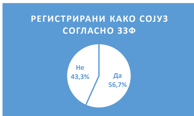
Графикон 3. Регистрирани мрежи согласно 33Ф (%)