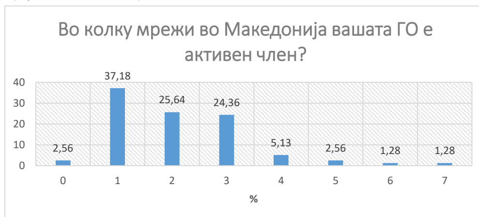
Графикон 2. Број на членства во мрежи

Една третина од граѓанските организации кои не членуваат во ниту една мрежа, како причина ја навеле неинформираноста и тоа што досега не добиле покана да станат дел од некоја мрежа.